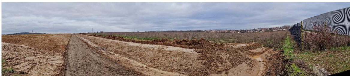
Figure 3. Vue du site depuis la route piétonne visite 27/01/2023

La ZAC du bois du temple est en cours de création. Actuellement le site est un terrain agricole.