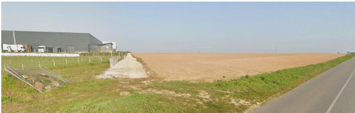
Figure 1. Vue google earth street view 04/2021