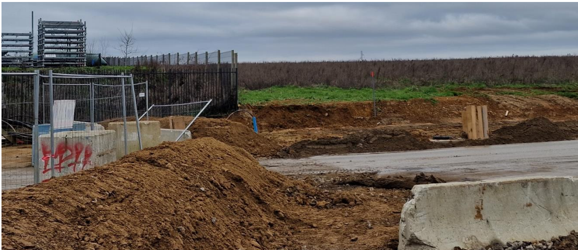
Figure 2. Vue du terrain depuis la route de la ZAC visite le 27-01-2023